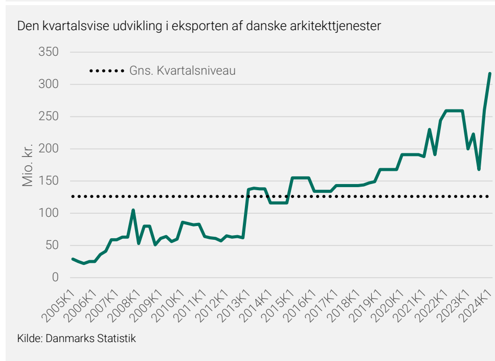
Figur 1: Dansk arkitektureksport slår rekord

Den øgede arkitektureksport kan skyldes øget international efterspørgsel efter dansk arkitektur, men også gunstige økonomiske forhold i andre lande. Sverige fylder isoleret set godt i første kvartal, hvor de stod for 20 procent af den samlede eksportstigning. Stigningen skal ses i konteksten af, at den svenske økonomi har